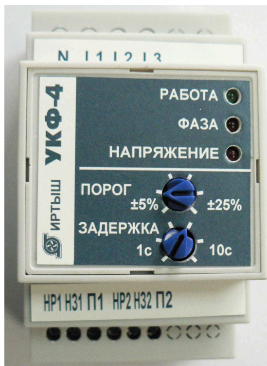
Рисунок 1. Внешний вид изделия

На верхней плоскости крышки располагаются три индикатора. Индикатор РАБОТА сигнализирует о подаче на изделие кондиционного напряжения питания. Индикатор ФАЗА сигнализирует о неправильном порядке чередования фаз, отсутствии одной из фаз или слипании фаз. Индикатор НАПРЯЖЕНИЕ сигнализирует о повышенном или пониженном напряжении на одной или нескольких фазах. Регулятор ПОРОГ устанавливает возможные допустимые отклонения сетевого напряжения в пределах \pm 5\% .. \pm 25\% . Регулятор ЗАДЕРЖКА устанавливает время срабатывания/восстановления при возникновении аварийных режимов в сети питания.