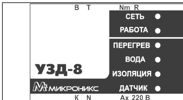
Рисунок 2 – наклейка на переднюю панель